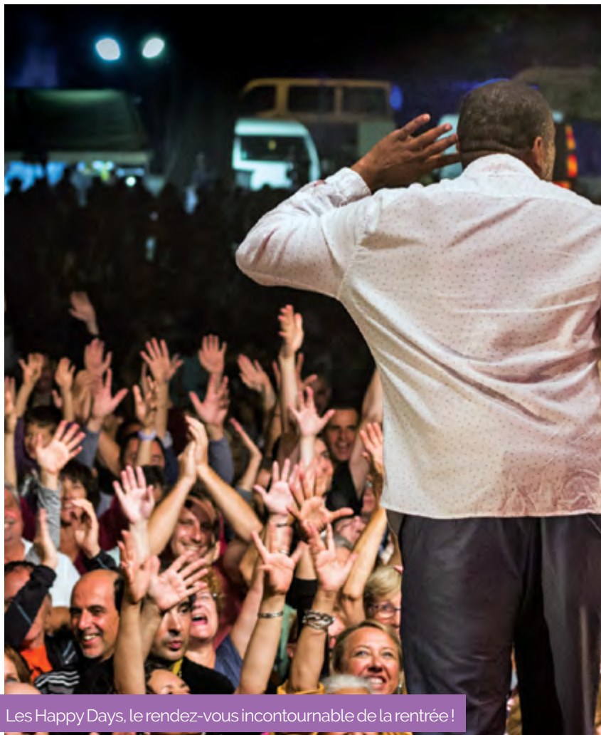
Les Happy Days, le rendez-vous incontournable de la rentrée !

Après la mauvaise surprise météo de l'année dernière – qui a entraîné l'annulation de l'édition 2017 – il en fallait du courage et de la détermination pour poursuivre l'aventure. Fortement impactée par cette déconvenue, l'association Happy Days a cependant relancé la dynamique du festival , grâce à la tenacité des organisateurs, au soutien des sponsors et à la passion des bénévoles. C'est donc sous un soleil radieux de fin d'après-midi que les concerts du festival ont débuté, attirant une foule nombreuse et familiale .