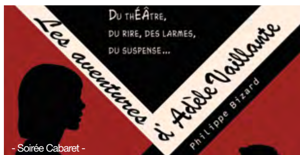
- Soirée Cabaret -

C'est la psy la plus connue de la planète. Elle soigne ses clients en une seule séance ! Elle les accompagne dans la réalisation de leurs fantasmes. Mais que cache donc Adèle Vaillante ? Cette psy parfaitement amoral ramène à la surface de vieilles envies inavouables, mais tellement naturelles.