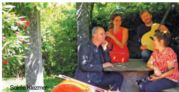
- Soirée Klezmer -

Rue du Mazel suit la route des musiciens juifs et des poètes yiddish d'Europe de l'Est, que le destin a fait naître dans un monde au bord du précipice. Tantôt festive tantôt tragique, la musique klezmer emporte ses auditeurs et ses interprètes dans un même élan de vie.