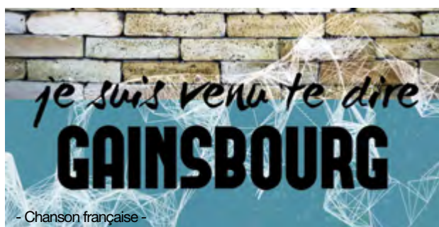
- Chanson française -

Le duo propose donc une immersion dans l'univers tamisé des premières années du chanteur, s'appropriant chaque chanson pour l'emmener sur un terrain personnel. Parfois populaires, parfois confidentielles, ces pépites méritaient toutes d'être à nouveau extraites : un répertoire d'âge mûr qui n'a pas pris une ride.